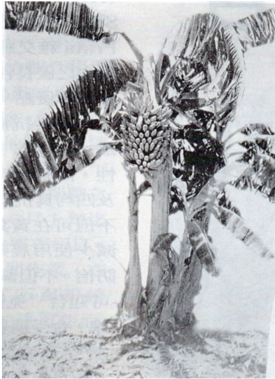
圖一：“金手指”香蕉的外型