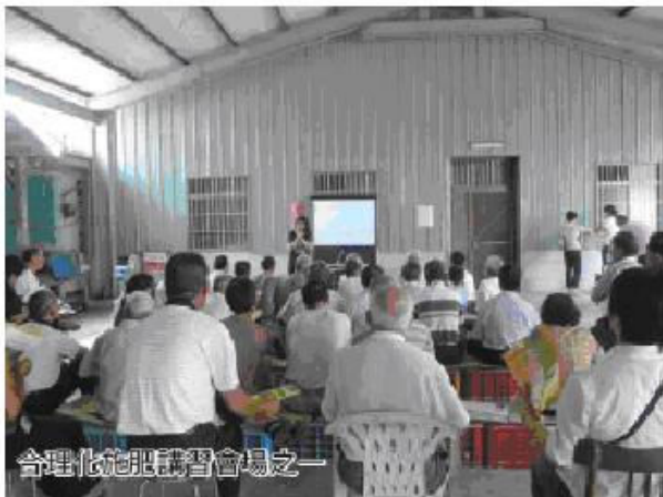
合理化施肥講習會場