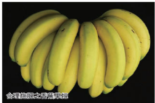
合理施肥之香蕉果把