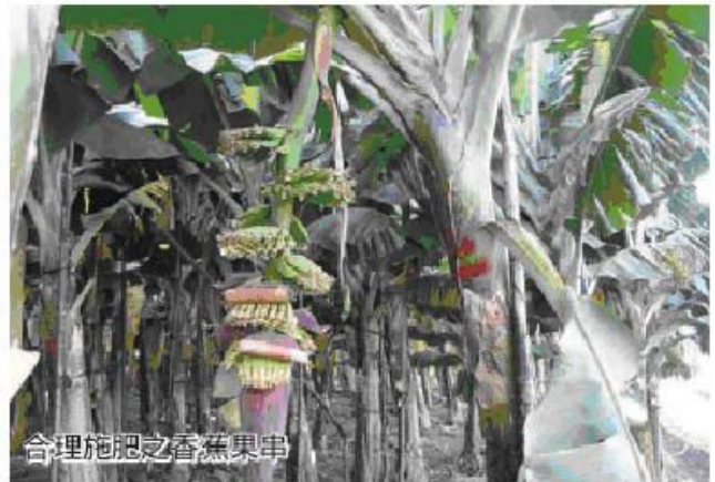
合理施肥之香蕉果串