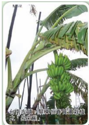
台南左鎮、屏東恒春普遍栽植之「呂宋蕉」

近年來，在政府鼓勵推動休閒農業及農產品市場多樣化的風潮下，各鄉鎮紛紛採取「一鄉鎮一特產」、少量多樣化、鄉土化的策略，藉以帶動地方觀光旅遊業。因此，國內芭蕉的平地栽培之芭蕉園種植面積，不分山區與平地，均有擴大的趨勢，芭蕉儼然已成為香蕉內銷市場不可或缺的品項。