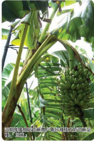
近期推廣受芭蕉農戶喜好種植之新芭蕉品種「皇蕉」