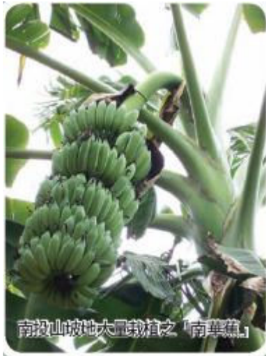
南投山坡地大量栽植之「南華蕉」