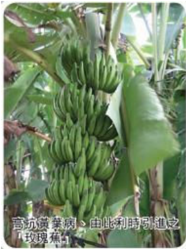
高抗黃葉病、由比利時引進之「玫瑰蕉」