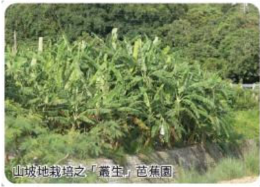
山坡地栽培之「叢生」芭蕉園