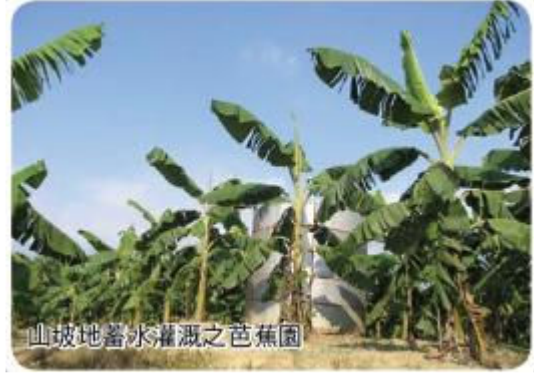
山坡地蓋水灌溉之芭蕉園