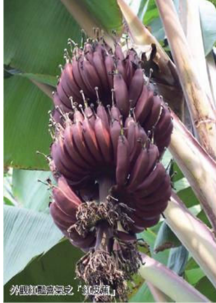
外觀紅暗香濃之「紅皮蕉」